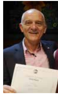
English Speech Italo